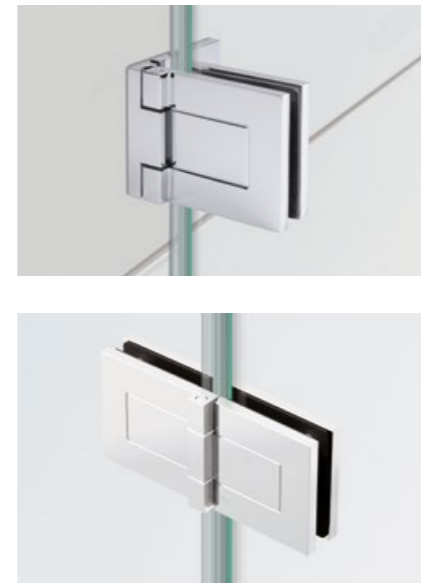
4 TANORA S1 Klassische Anschlagtüren, einseitig öffnend für den gängigen Duscheinstieg